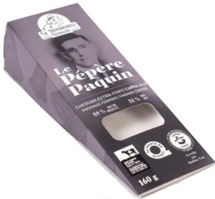
Le Pèpère Paquin (cheddar extra fort)