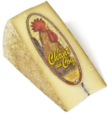
Le Chant du Coq (pâte ferme)