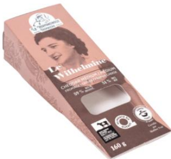
Le Wilhelmine (cheddar médium)