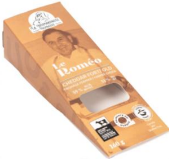
Le Roméo (cheddar fort)