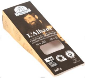
L'Albani (cheddar doux)