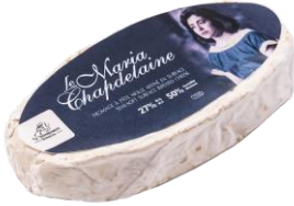
Le Maria Chapdelaine