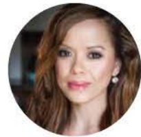
CRISTINA CARPIO Journaliste pour Food and Beverage magazine et animatrice télé